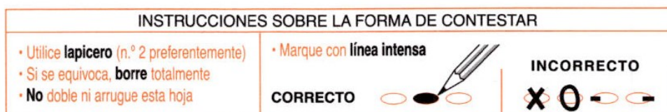
Gráfico N° 2